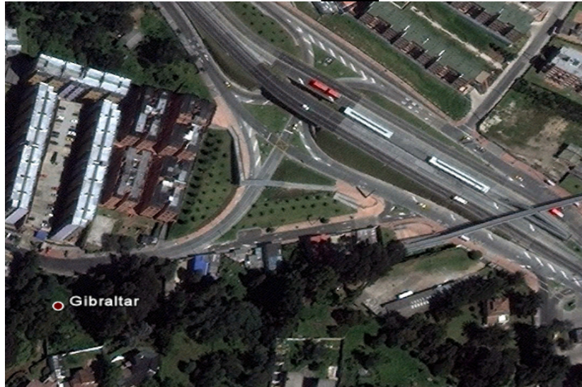
Foto 1. Interconector de la Av suba con 137 (Imagen de Google Earth). KR 84B No 137-28 (Nomenclatura Actual).